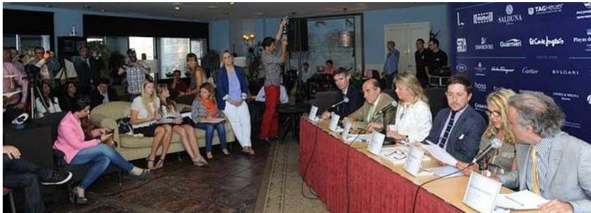
Un momento de la presentación, celebrada ayer en el Club del Mar de Puerto Banús.

El Marbella Luxury Weekend prestará este año especial atención a la moda 21.05.14 - 00:59 - HÉCTOR BARBOTTA | MARBELLA.