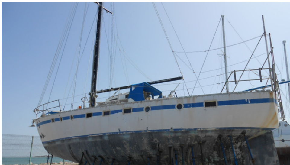
Embarcación subastada recientemente por la delegación de Puertos de Andalucía.

La crisis provoca que muchos propietarios descuiden su mantenimiento hasta llegar al abandono El sector náutico reclama una ley que permita desguazar estas embarcaciones para sacarlas de los puertos