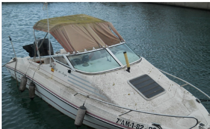
Embarcación subastada recientemente por Puertos de Andalucía.

Economizador de Safari Excelente vinos Haga clic para iniciar el módulo Flash a mitad de precio