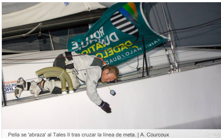
Pella se 'abrazo' al Tales II tras cruzar la línea de meta.

El barcelonés ha vencido a rivales que navegan en proyectos de hasta 500.000 euros , diez veces más dinero del que él ha podido reunir de fondos personales. La falta de recursos ha supuesto que, por ejemplo, las velas empleadas durante la regata fueran todas viejas. "Exceptuando una vela que se usa con poco viento y un 'spi' que tenía pocas horas de uso, el resto son las que hemos usado siempre", explican desde su equipo de tierra.