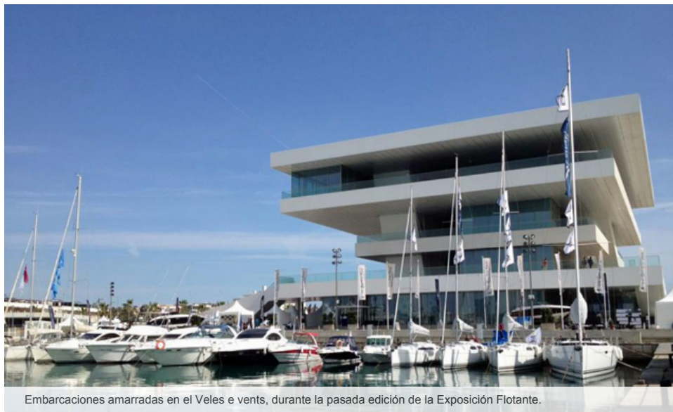
Embarcaciones amarradas en el Veles e vents, durante la pasada edición de la Exposición Flotante.