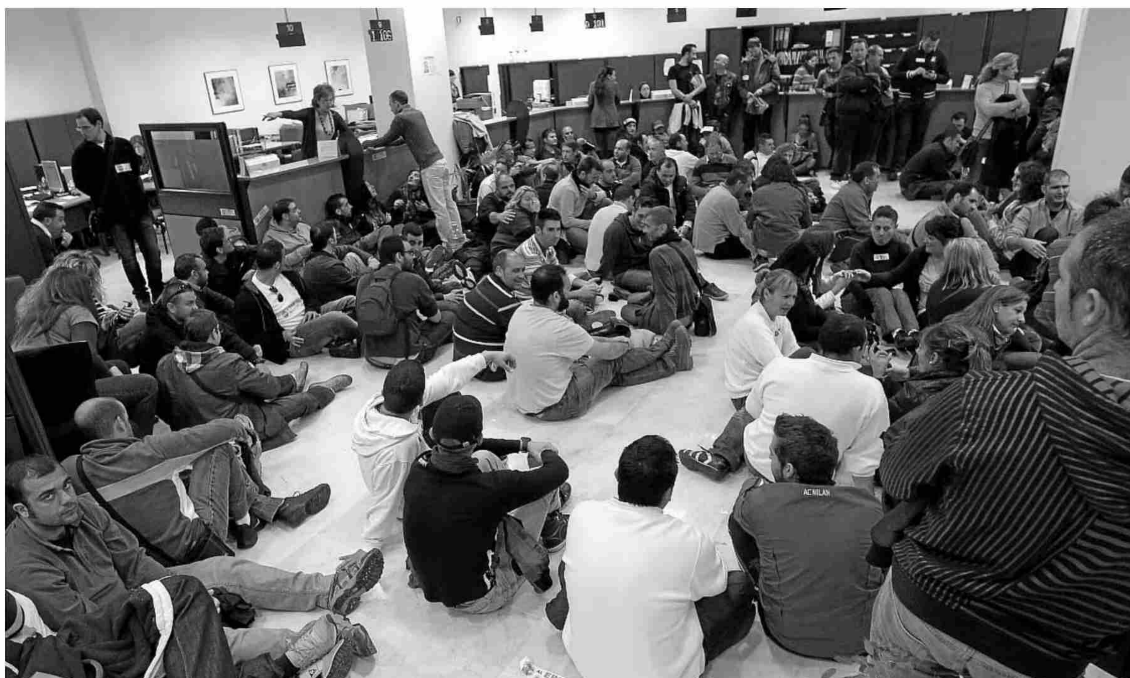
Más de 200 empleados se encerraron ayer en la delegación de Economía.