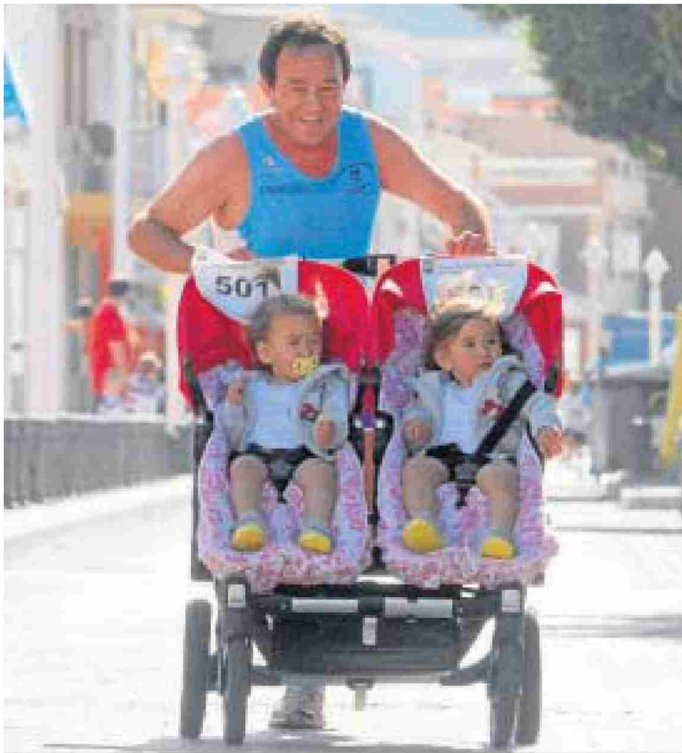
Uno de los participantes corre con sus hijos.

ATLETISMO ▶ XXXV CARRERA POPULAR EL PALO