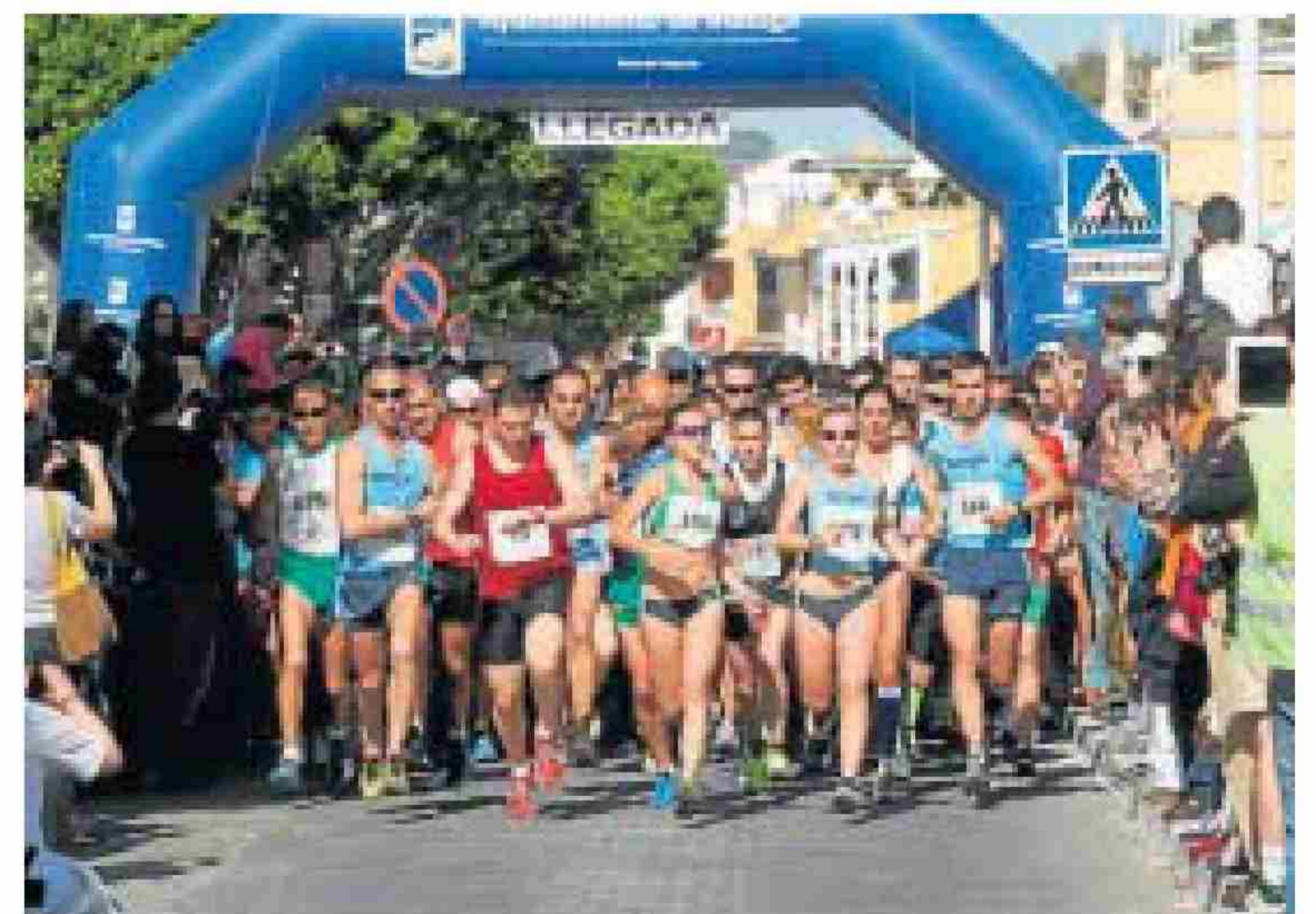
Imagen de la salida de la carrera.

Se recogieron más de 1.000 kilos de alimentos destinados a las familias más necesitadas