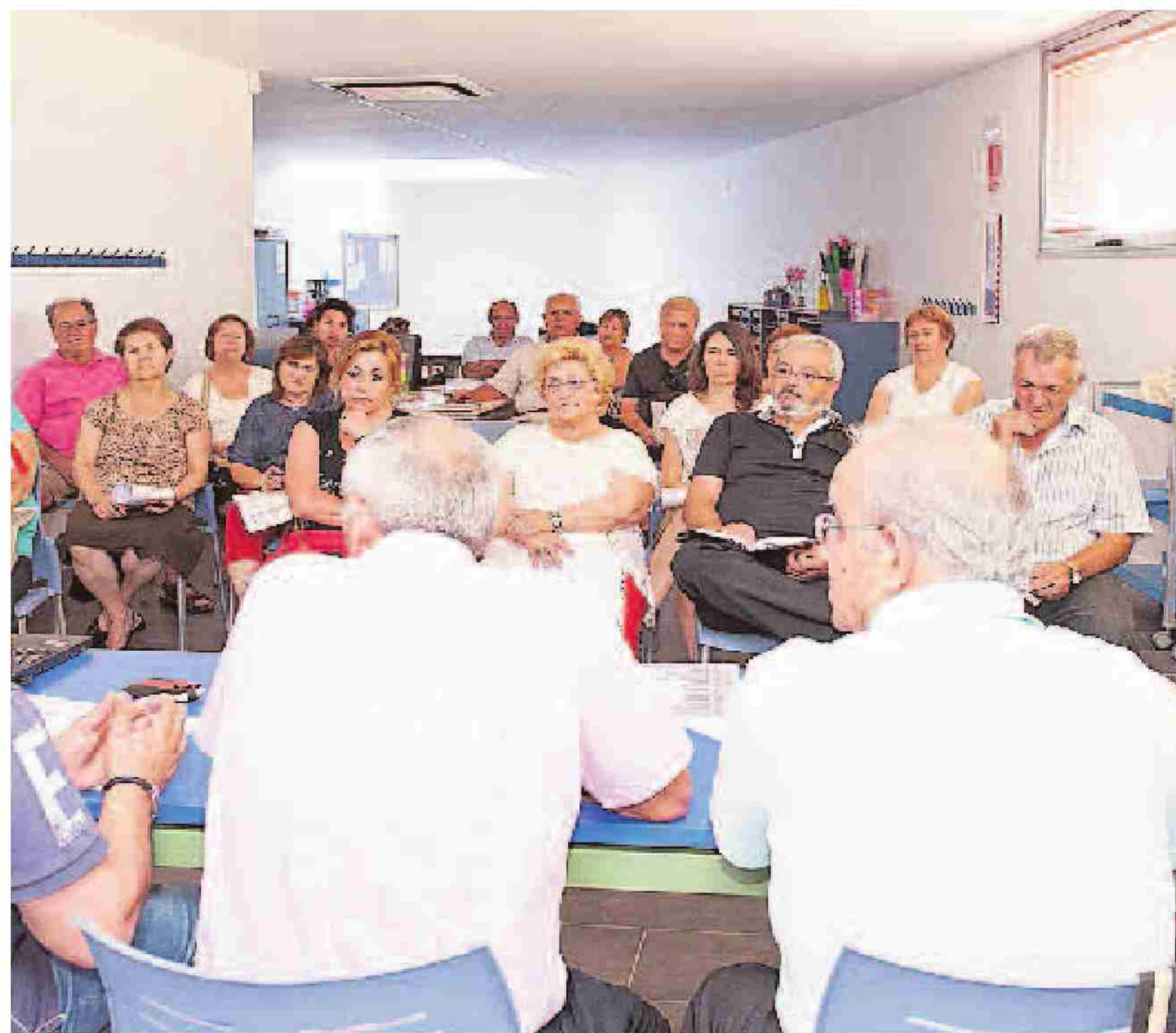
Reunión de asociaciones de vecinos en el centro cívico.