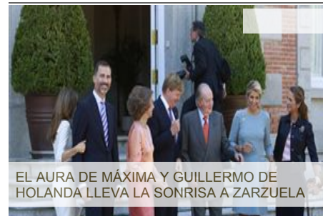
EL AURA DE MÁXIMA Y GUILLERMO DE HOLANDA LLEVA LA SONRISA A ZARZUELA