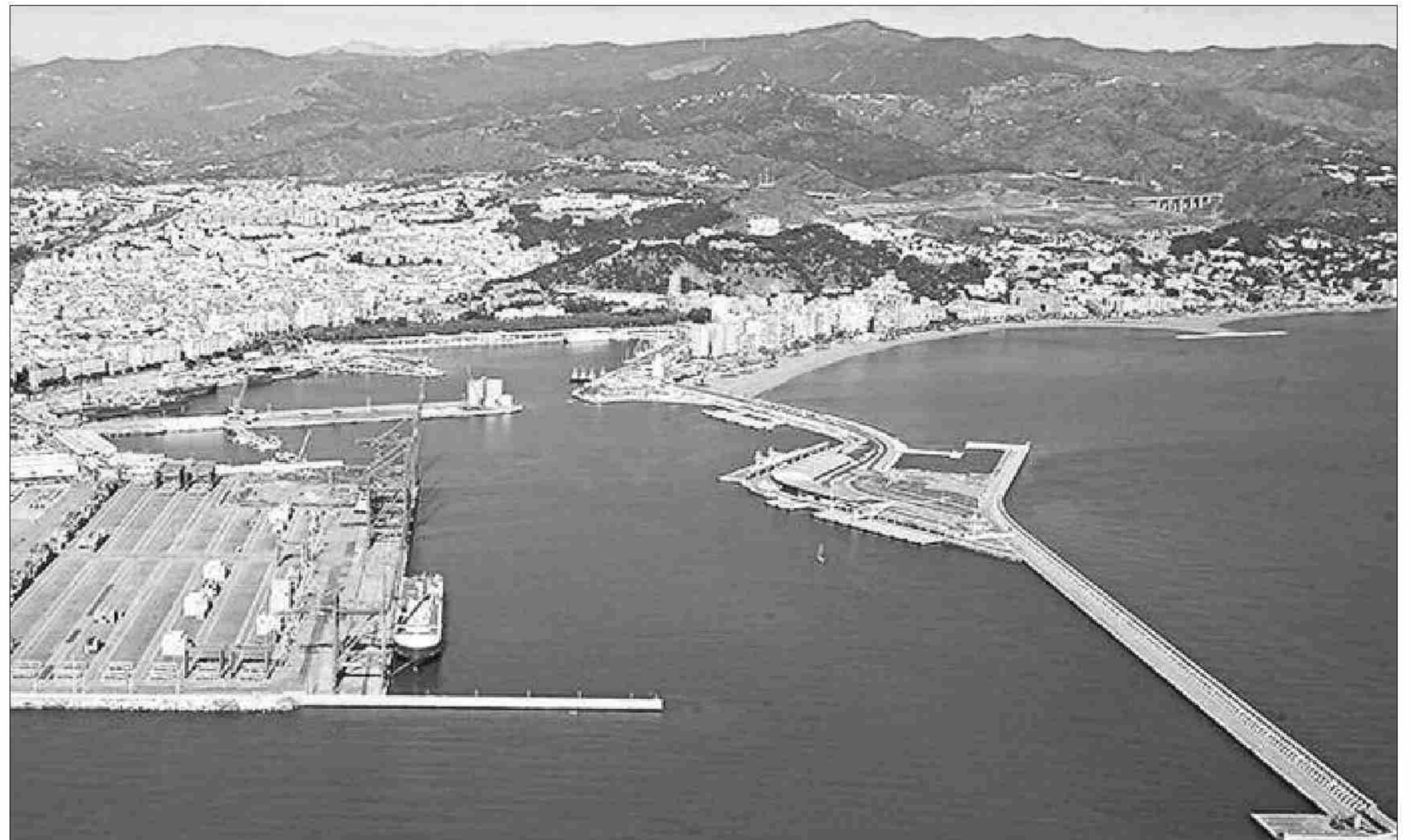
El nuevo puerto deportivo está en la parte de atrás del dique de Levante.

Av. Los Vegas 47 Pol. Ind. El Viso Málaga Telf./Fax: 952 33 45 07 www.moto-fast.es info@moto-fast.es