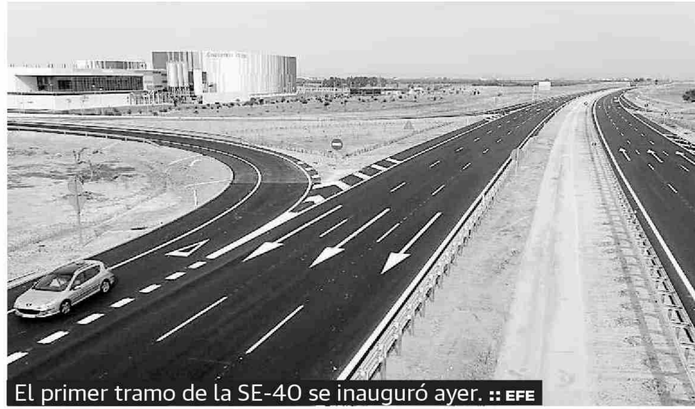
El primer tramo de la SE-40 se inauguró ayer.

ción ha sido parcial, la nueva carretera beneficiará a las comunicaciones entre Málaga y la capital hispalense, puesto que se ha habilitado un enlace con la A-92, donde se permitirán los movimientos de tráfico en ambas direcciones hacia los destinos de la Costa del Sol y Granada. Según informó el Ministerio, el tramo La Rinconada-Alcalá de Guadaíra, con una longitud de 10,16 kilómetros, ha supuesto una inversión de más de 108 millones de euros.