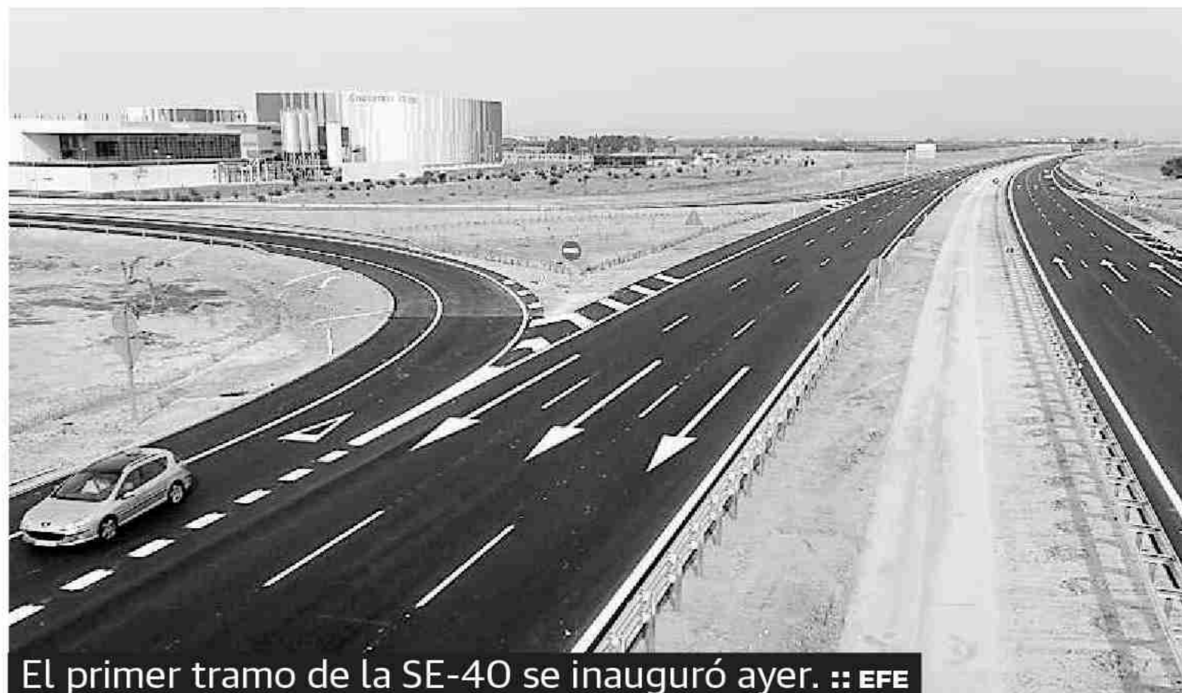
El primer tramo de la SE-40 se inauguró ayer.

ción ha sido parcial, la nueva carretera beneficiará a las comunicaciones entre Málaga y la capital hispalense, puesto que se ha habilitado un enlace con la A-92, donde se permitirán los movimientos de tráfico en ambas direcciones hacia los destinos de la Costa del Sol y Granada. Según informó el Ministerio, el tramo La Rinconada-Alcalá de Guadaíra, con una longitud de 10,16 kilómetros, ha supuesto una inversión de más de 108 millones de euros.