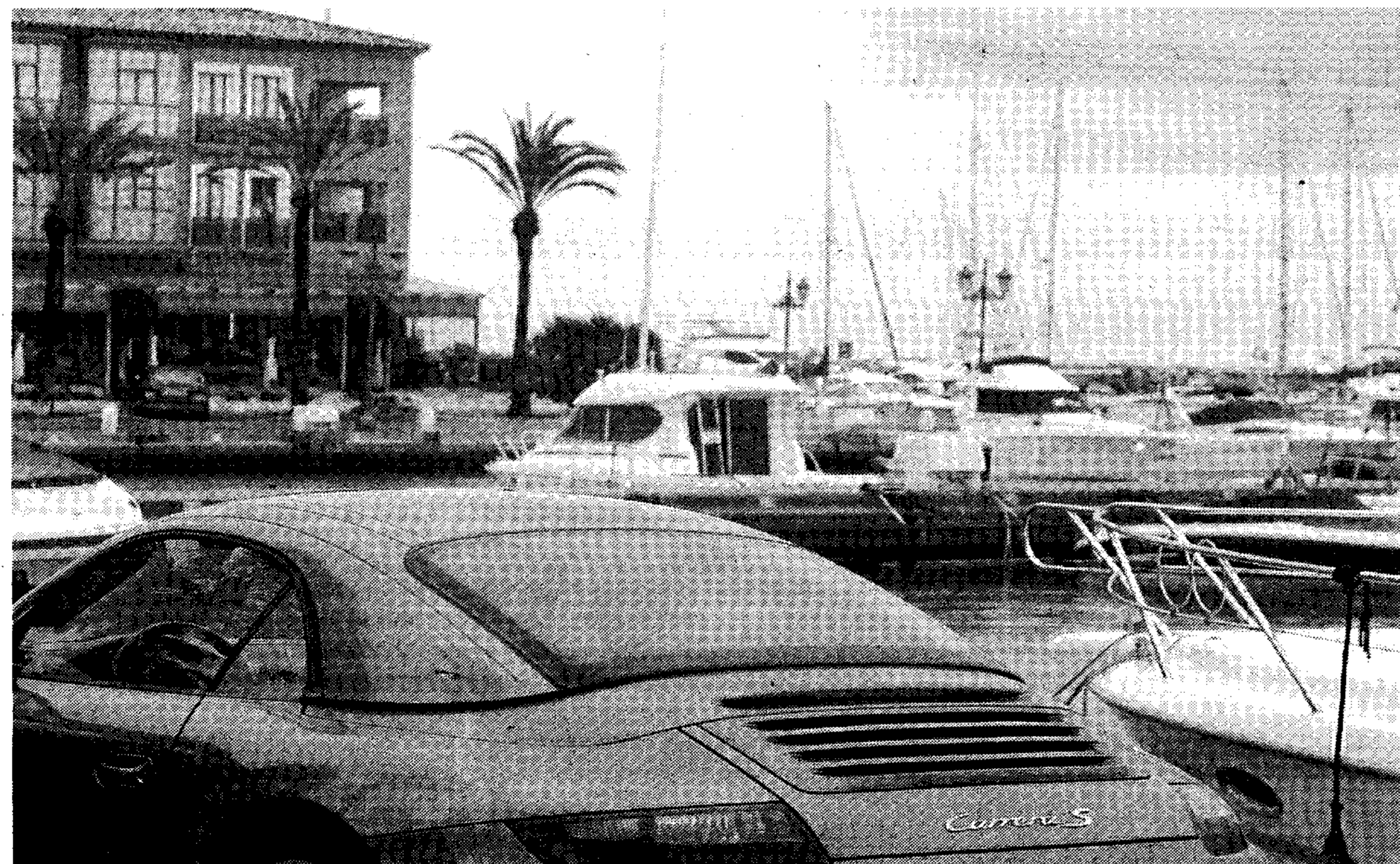
El puerto deportivo de Sotogrande, en una imagen de archivo.

La asociación considera que cometió prevaricación y exacción al no respetar los títulos de concesión de los puertos deportivos. Sotogrande está entre los afectados