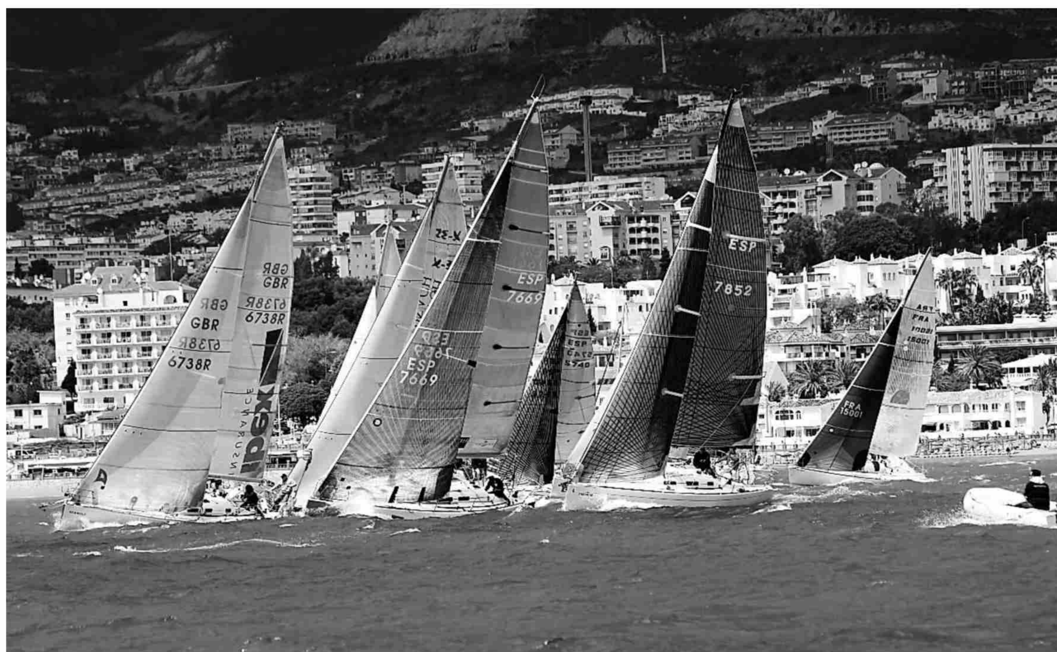
Varias embarcaciones, en una de las mangas de la pasada edición de la Semana Náutica.

En esta edición se espera una participación superior a la treintena de barcos provenientes de diferentes puertos de la geografía andaluza. Habrá embarcaciones desde 7 hasta 15 metros de eslora que intentarán conseguir los diferentes premios para las clases integrantes. Además, se contará con la presencia de alrededor de 150 regatistas asiduos todos ellos a las regatas de alto nivel de la vela de crucero.