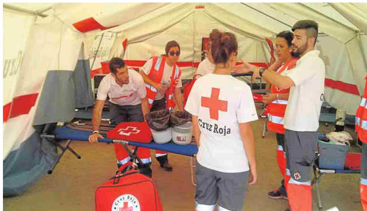
Uno de los campamentos de emergencias que montó Cruz Roja en el Hipódromo.

La Junta presentó en 2007 un proyecto con 500 atraques y una inversión de 33 millones de euros