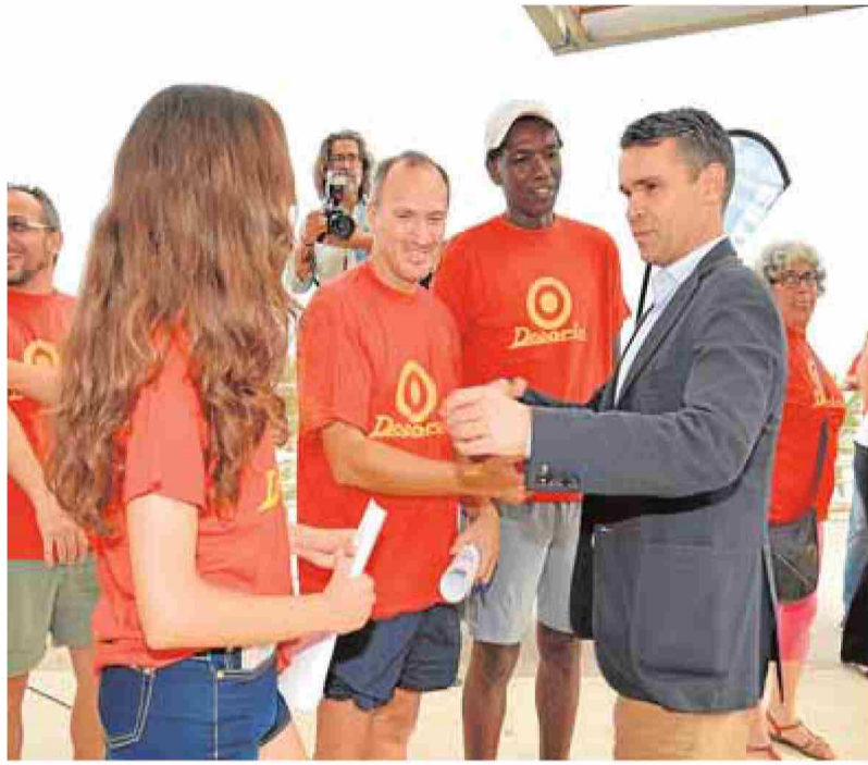
Los voluntarios de la Vuelta Ciclista a España junto a Bernal