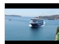
UNA MANIOBRA ARRIESGADA