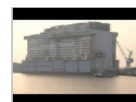
Botadura del crucero NORWEGIAN ESCAPE