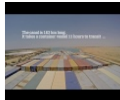
Navegando por el nuevo canal de Suez (Maersk Line)