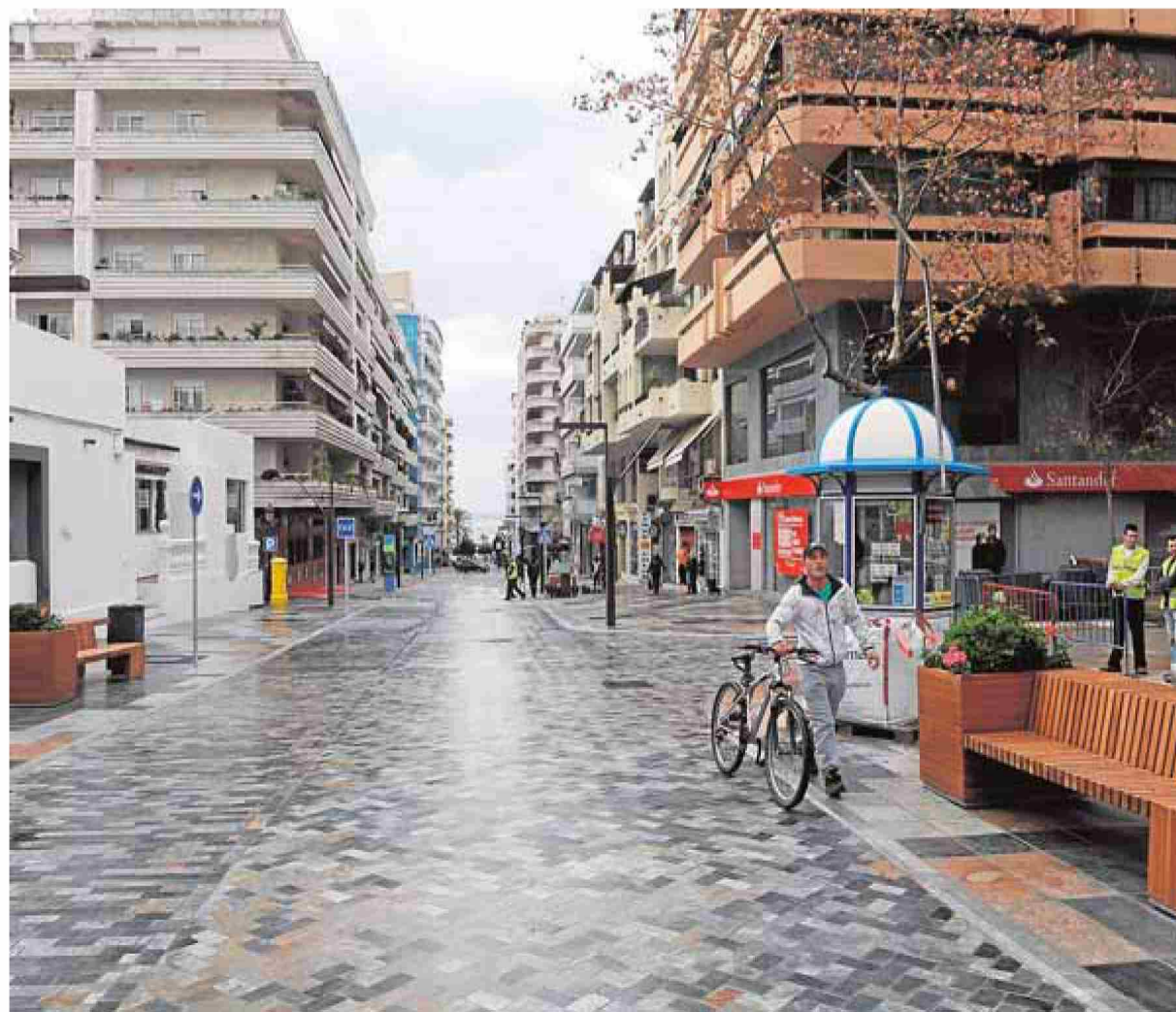
La avenida, que conecta Ricardo Soriano y el Paseo Marítimo, ha ganado en espacios peatonales. :: J.-L.

Según el planeamiento urbanístico aprobado en 2010, el inmueble ocupa viario público. El equipo de gobierno pretendía expropiarlo para ensanchar la calle José Vera dotándola de un doble carril. Eso ya no será posible, pero la alternativa está clara. Según el concejal responsable de Obras, Javier García, «la idea sigue siendo mejorar los accesos al Puerto Deportivo desde Antonio Belón. Si no puede ser con un doble carril, será con uno solo pero con doble sentido, dando prioridad mediante señalización vertical a uno de ellos». La calzada y la acera se pondrán al mismo nivel de la vivienda existente en el viario público. En este caso, el presupuesto asciende a 445.000 euros y correrá a cargo de las arcas municipales.