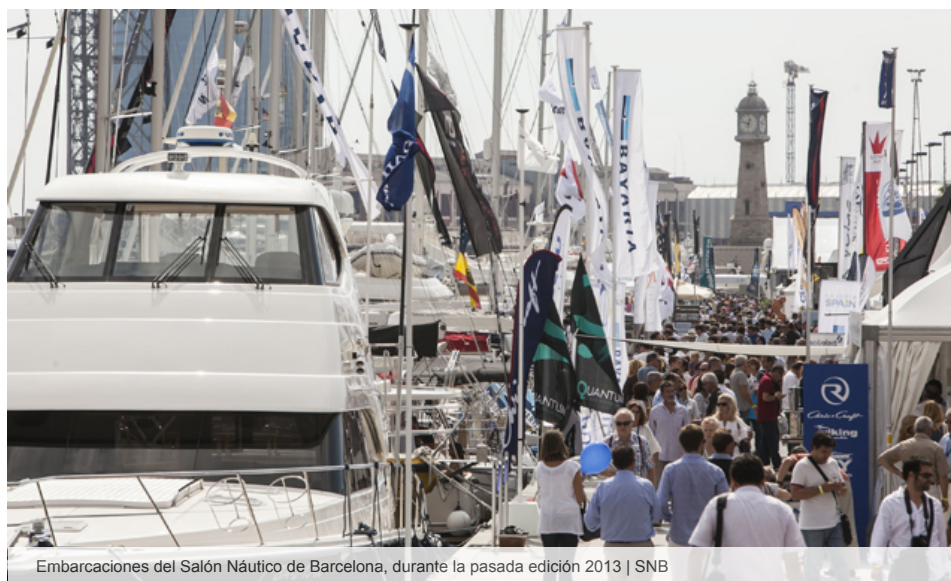
Embarcaciones del Salón Náutico de Barcelona, durante la pasada edición 2013

Se celebrará del 15 al 19 de octubre en Port Vell para conseguir una mayor proyección