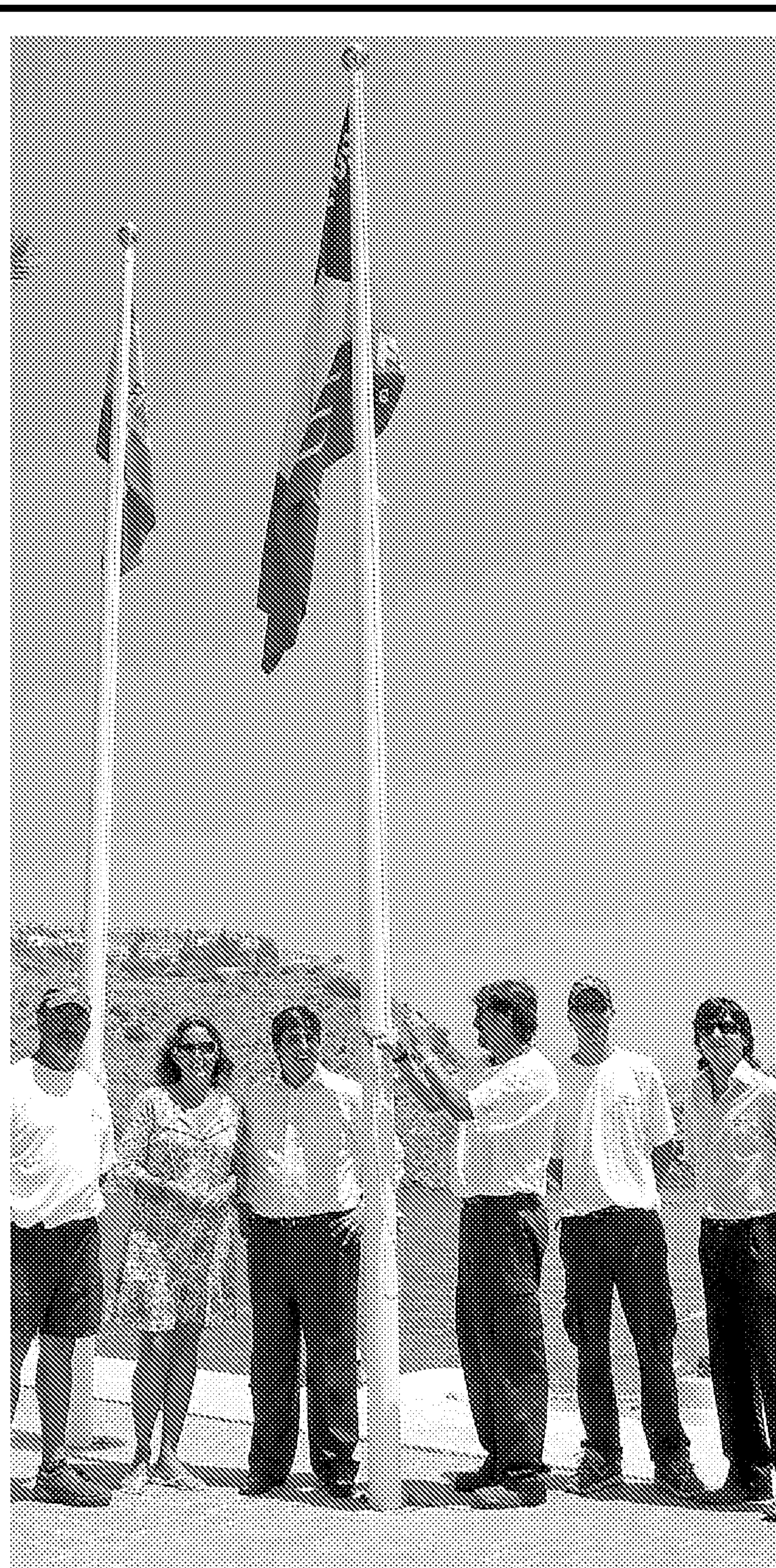
PUERTO. Trabajadores e invitados al acto de ayer.