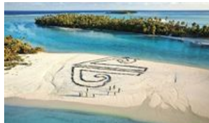
Islas Cook, el paraíso más 'eco'