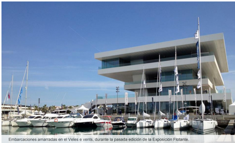
Embarcaciones amarradas en el Veles e vents, durante la pasada edición de la Exposición Flotante.