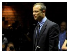
Se reanuda la vista sobre la libertad bajo fianza de Pistorius