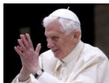
Las cuentas de Twitter de Benedicto XVI dejarán de funcionar el 28 de febrero