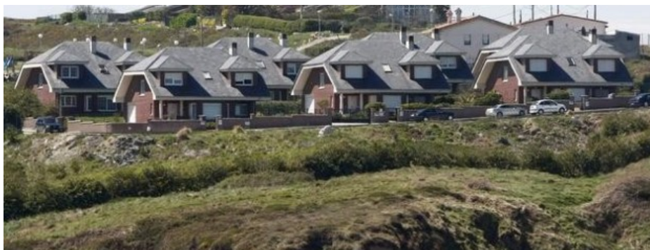
Una urbanización en la costa cántabra de Liencres.