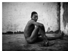
El cruel abandono de los enfermos mentales en África