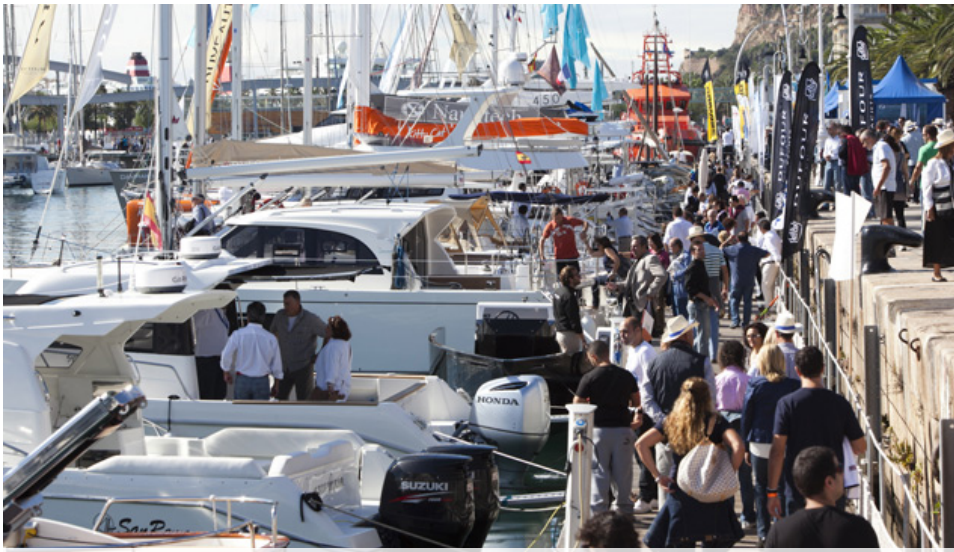
Embarcaciones del Salón Náutico de Barcelona en Port Vell. | SB