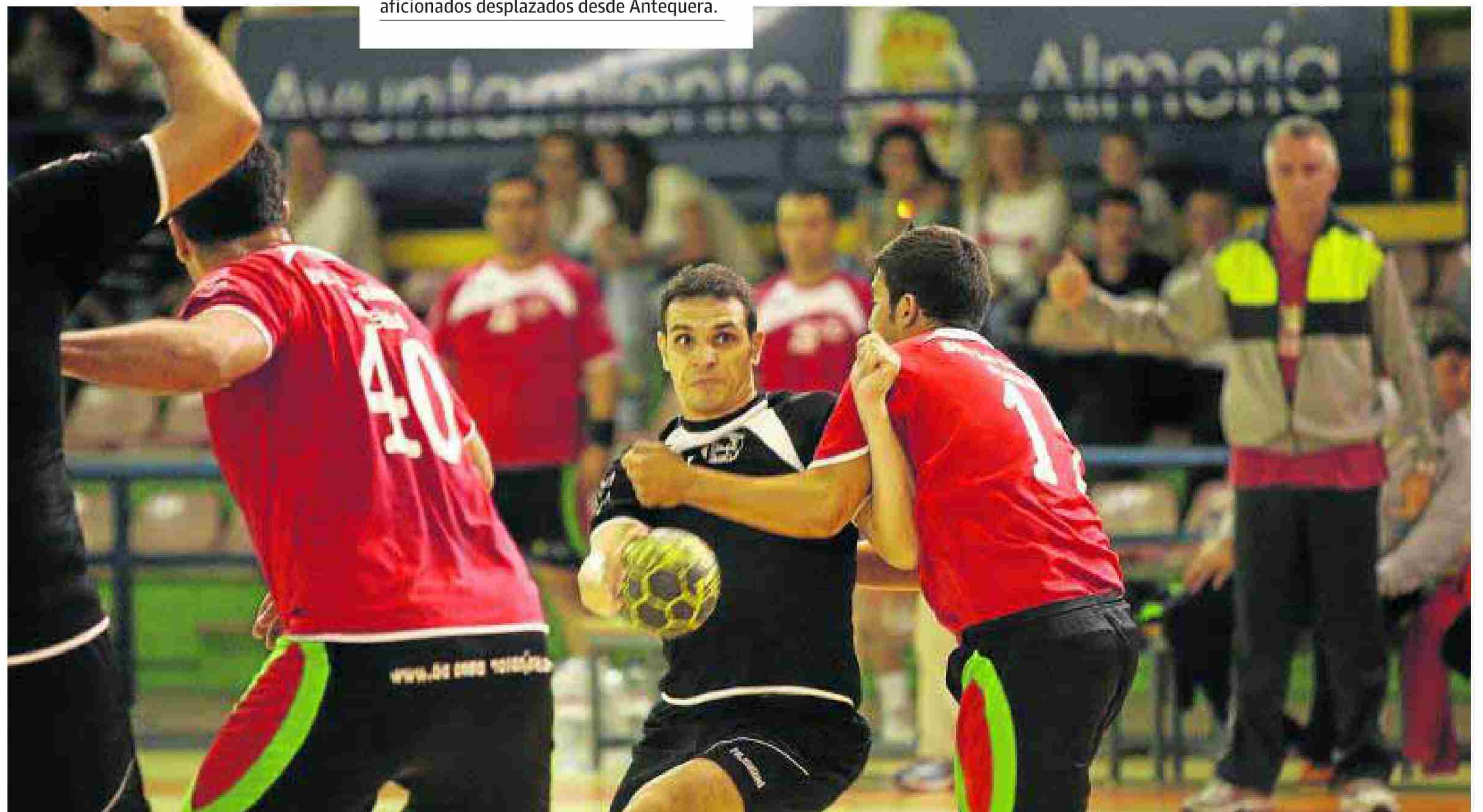
Jugada del Balonmano La Cañada en un partido en el Pabellón Rafael Florido. :: IDEAL

Incidencias: Encuentro disputado en el Pabellón Rafael Florido de la capital ante más de un centenar de espectadores. El público despidió con una ovación a los jugadores locales agradeciéndoles el esfuerzo realizado. Presencia en las gradas de un grupo de aficionados desplazados desde Antequera.