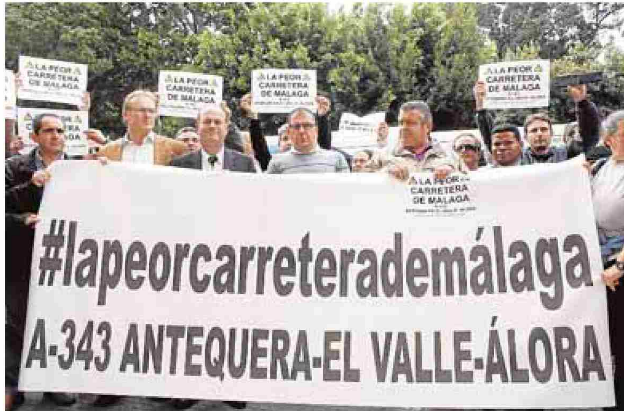
Unos 60 vecinos acompañaron a los alcaldes.