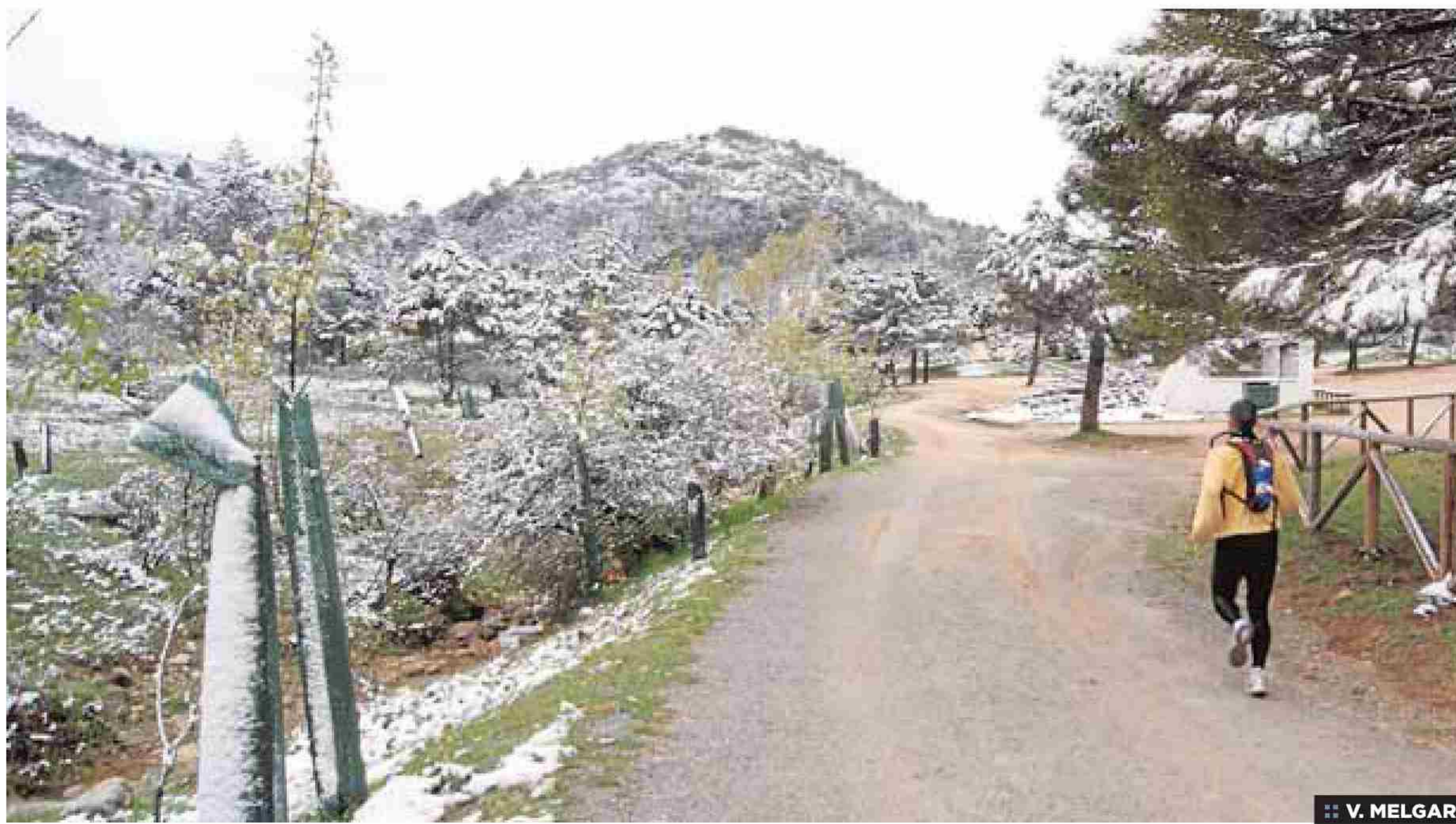
:: V. MELGAR

La nieve tiñe desde la tarde del pasado domingo las cumbres más altas de la Serranía de Ronda después de la nevada que cogió por sorpresa a los vecinos de la ciudad del Tajo en plena primavera. Ayer en la Sierra de las Nieves se podían disfrutar aún de estampas como la que muestra la fotografía. Los termómetros han caído hasta valores casi negativos haciendo que los rondños vuelvan a sacar de los armarios abrigos y bufandas.