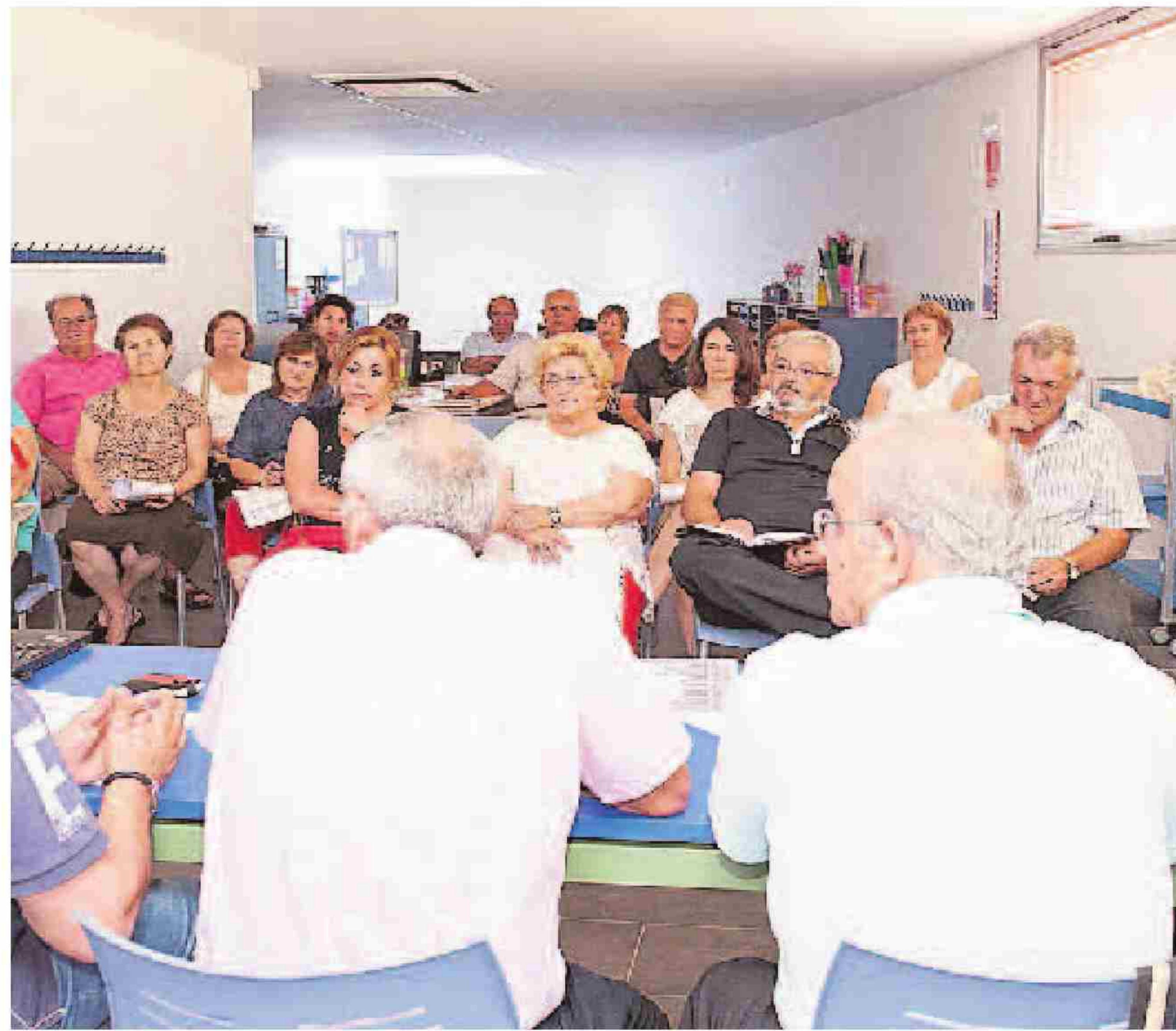
Reunión de asociaciones de vecinos en el centro cívico.