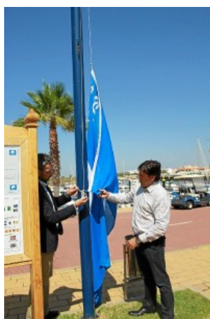
Bandera Azul en Ayamonte.

junio 26, 2013 | Filed under: A-Tema del día,Ayamonte,Provincia | Posted by: redaccion2