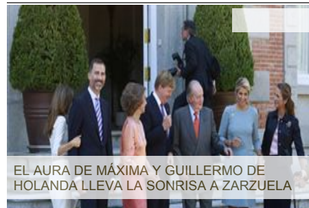
EL AURA DE MÁXIMA Y GUILLERMO DE HOLANDA LLEVA LA SONRISA A ZARZUELA