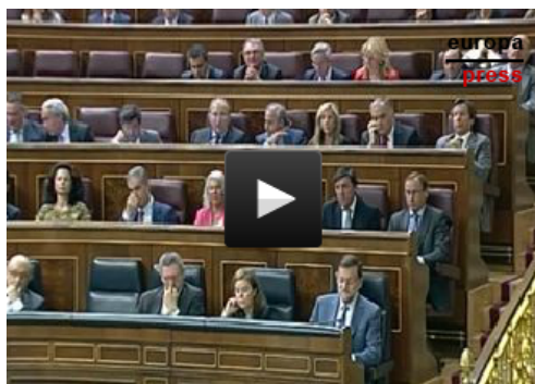
CEAPA critica a Wert por sus declaraciones en el Congreso