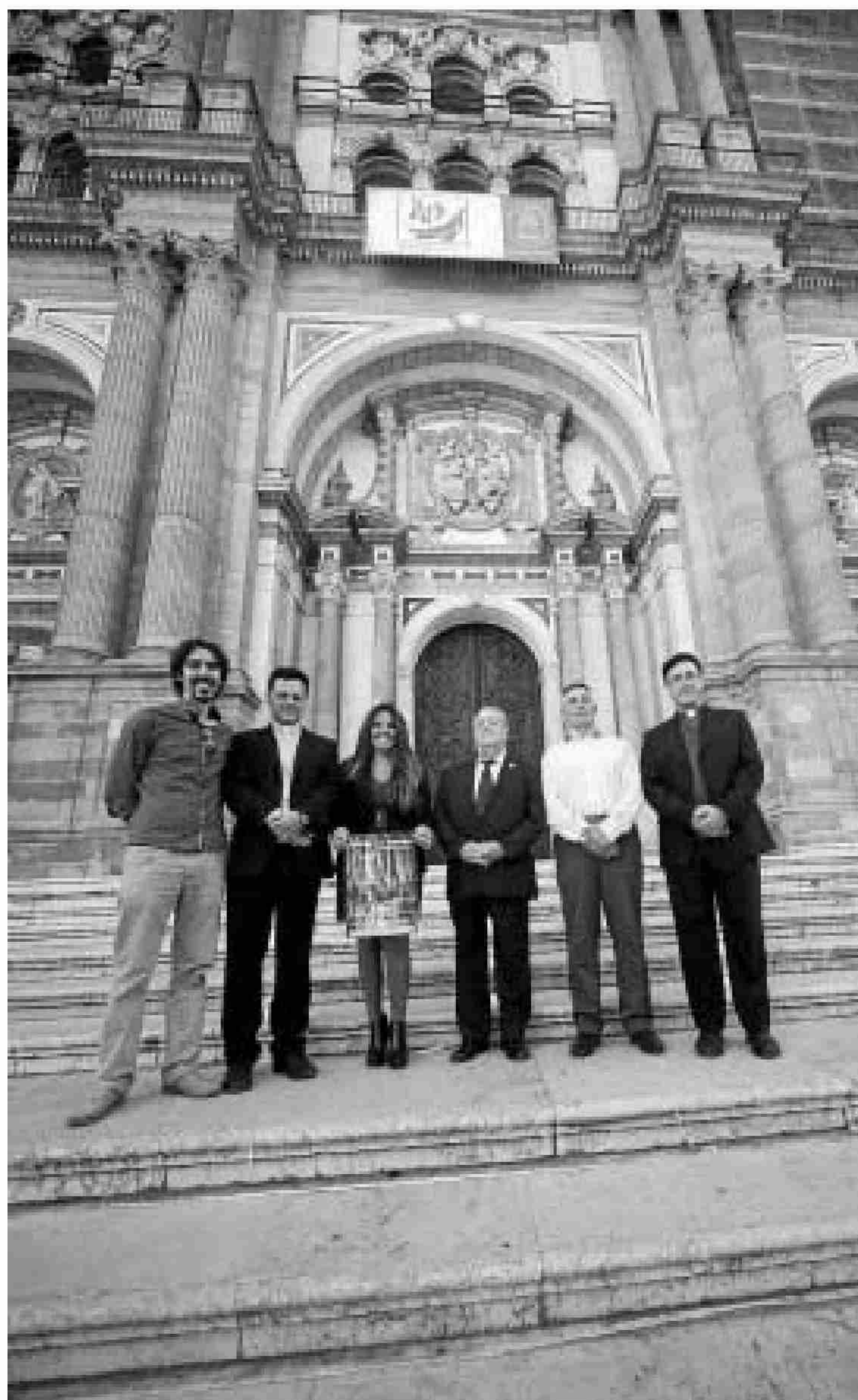
Presentación de 'Desde lo hondo', ayer, en la Catedral.

Desde lo hondo es un proyecto promovido por la Diócesis de Málaga en el marco del Año de la fe, y surge de la inspiración de Benedicto XVI al sugerir un "Atrio de los Gentiles" como lugar de encuentro y de propuesta de fe cristiana. El proyecto encarna además, en un modo de expresión popular, la experiencia creyente de la Iglesia.