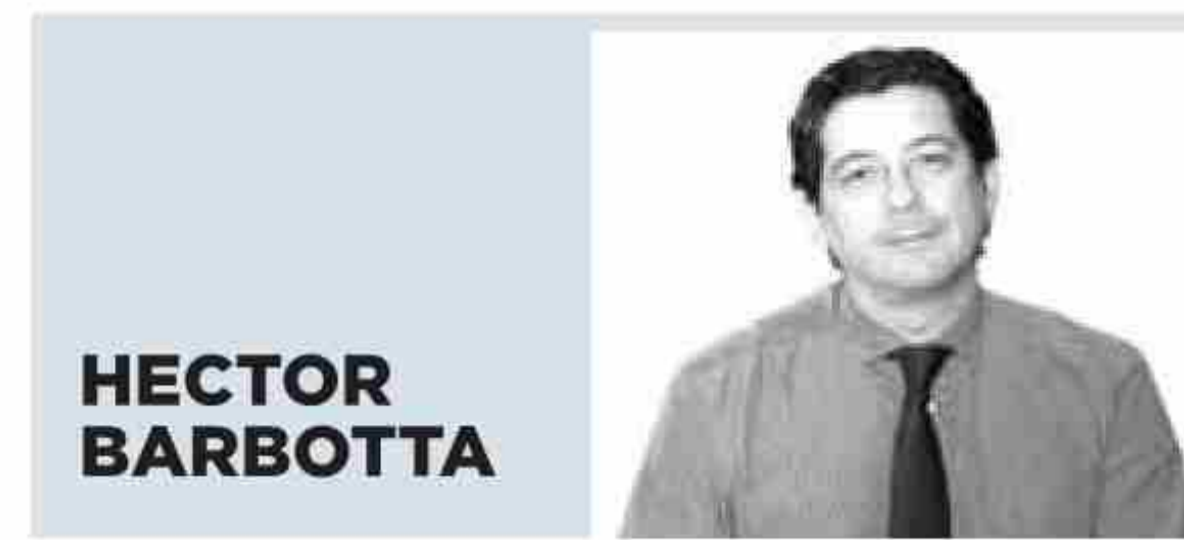
En Twitter: @barbotta

La APPA se pone de plazo hasta fin de año para recibir el proyecto constructivo, aunque este documento no está siendo elaborado