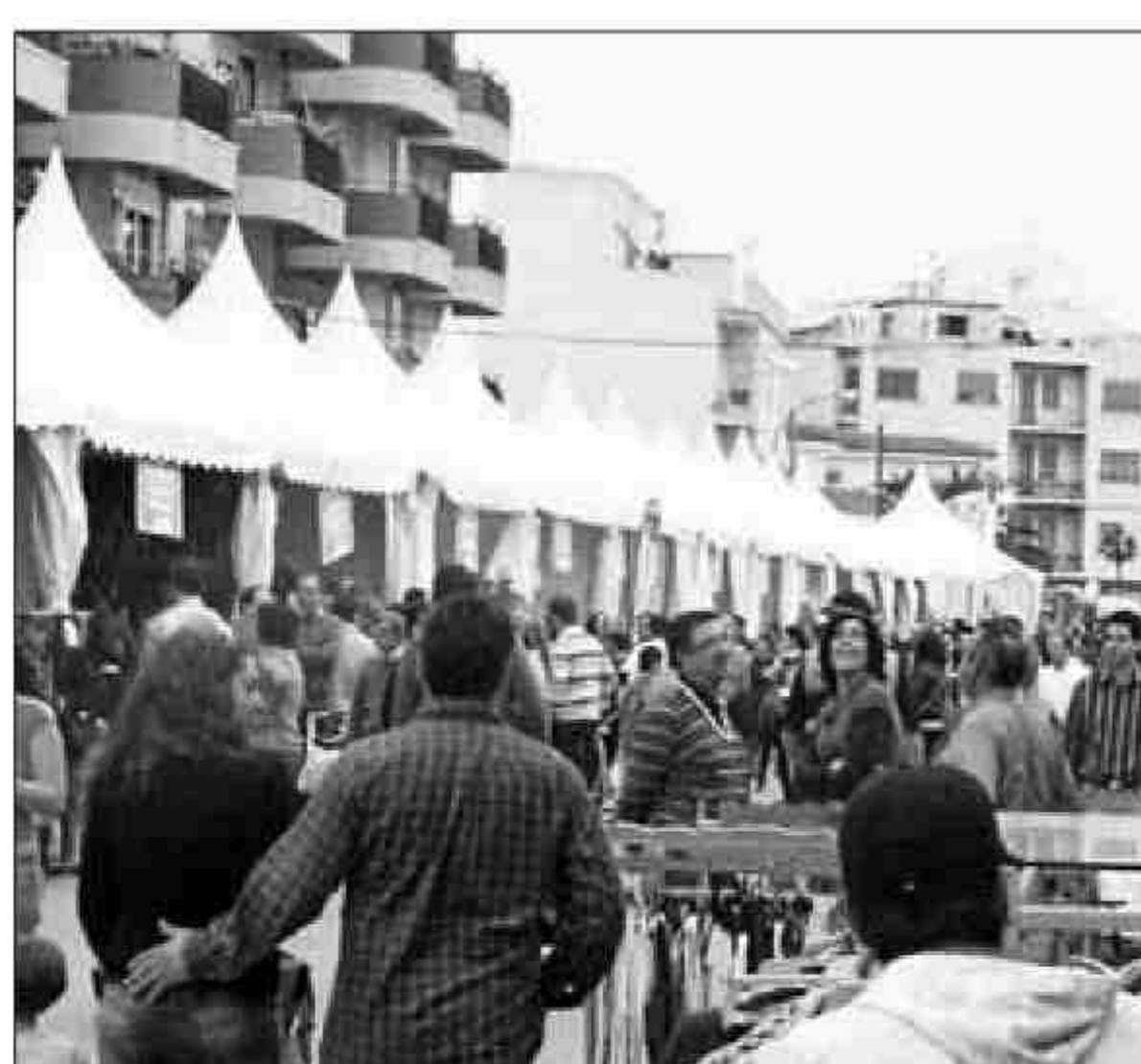
■ Éxito de público en 2011.

Este fin de semana se celebra en Albox una nueva edición del mercadillo de saldos que organiza AEPA y que durante la mañana y tarde del sábado y domingo se instalará en la Avenida Puente.