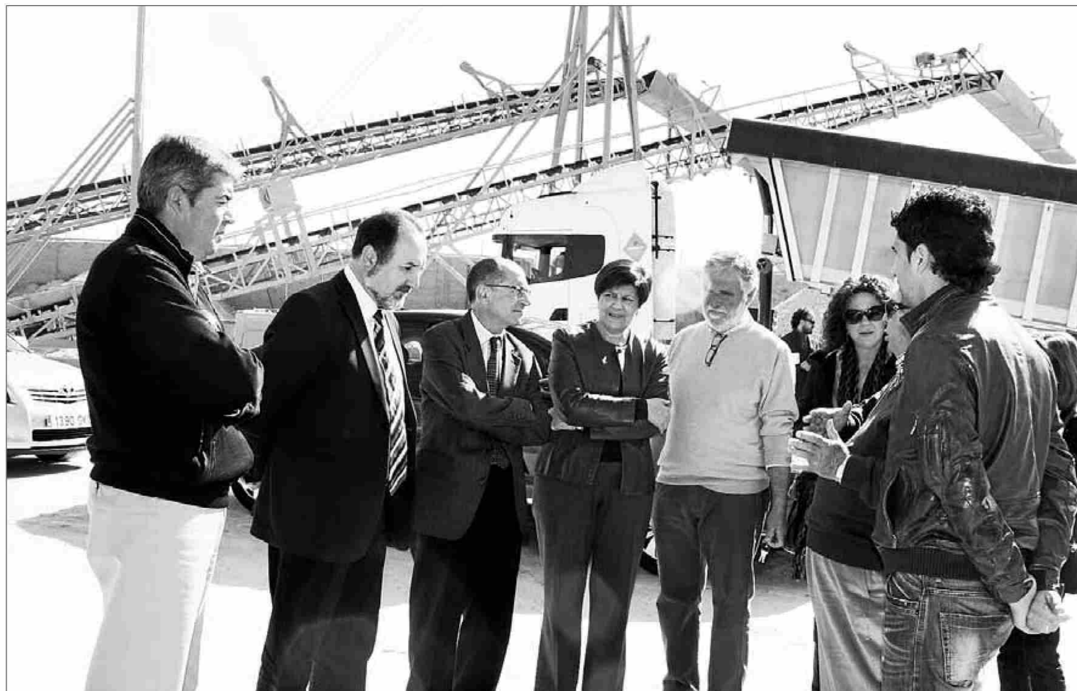
■ La consejera y demás autoridades escuchan las explicaciones sobre las obras en el puerto.

sefina Cruz para visitar las obras del soterramiento de los accesos al puerto, que se han vuelto a reanudar hace unos días y que según ha explicado la consejera no se pararán ya que son unas obras de las consideradas prioritarias, afirmando que para finales de año estarán finalizadas.