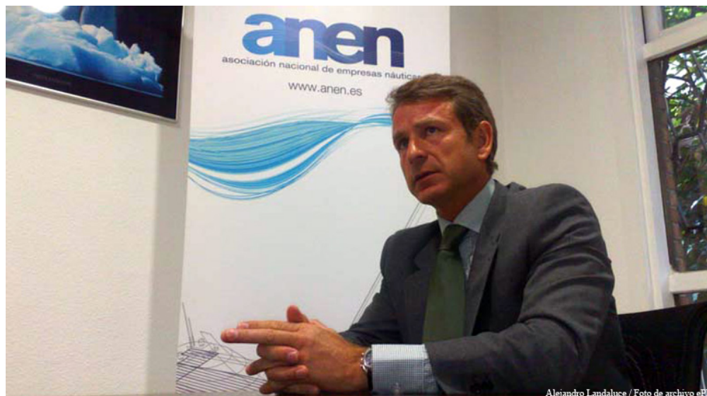
Alejandro Landaluce / Foto de archivo ePN