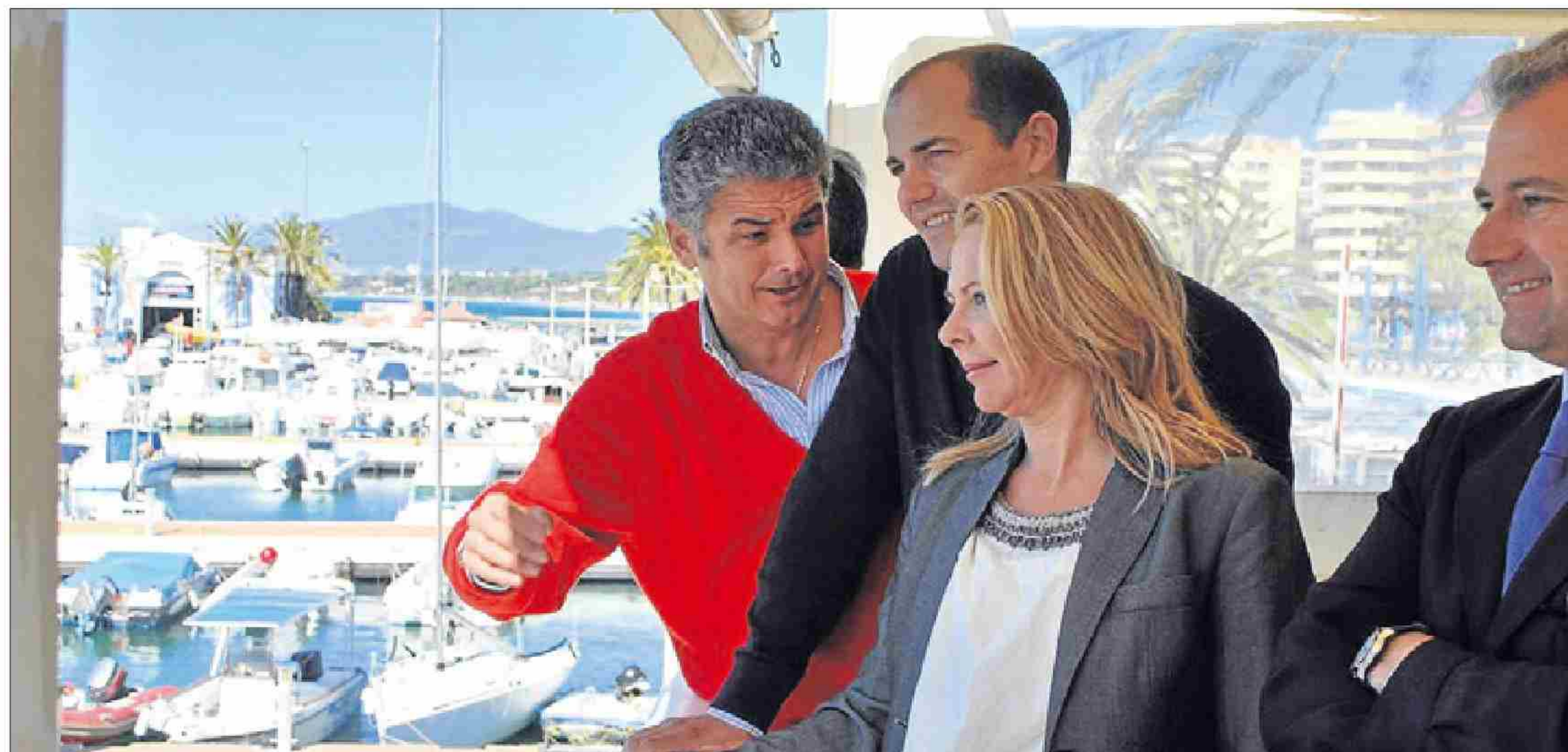
Delegados de la Mancomunidad presentaron ayer el evento.