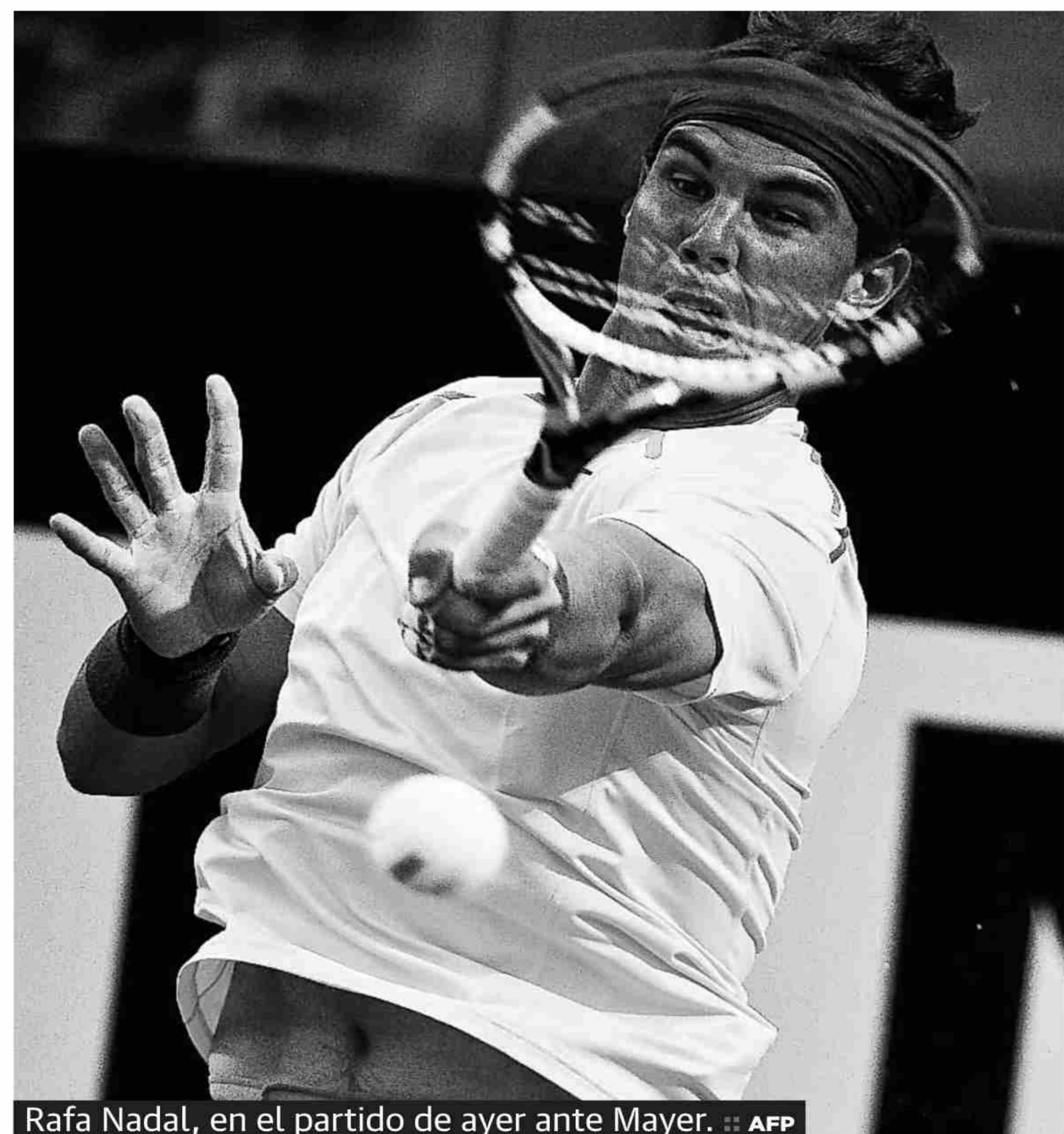
Rafa Nadal, en el partido de ayer ante Mayer.

En cuanto a los otros dos españoles que jugaron ayer en Roma tuvieron un resultado dispar: Almagro ganó a Querrey (7-5 y 6-2), pero García-López cayó ante Simon (4-6, 6-2 y 4-6).