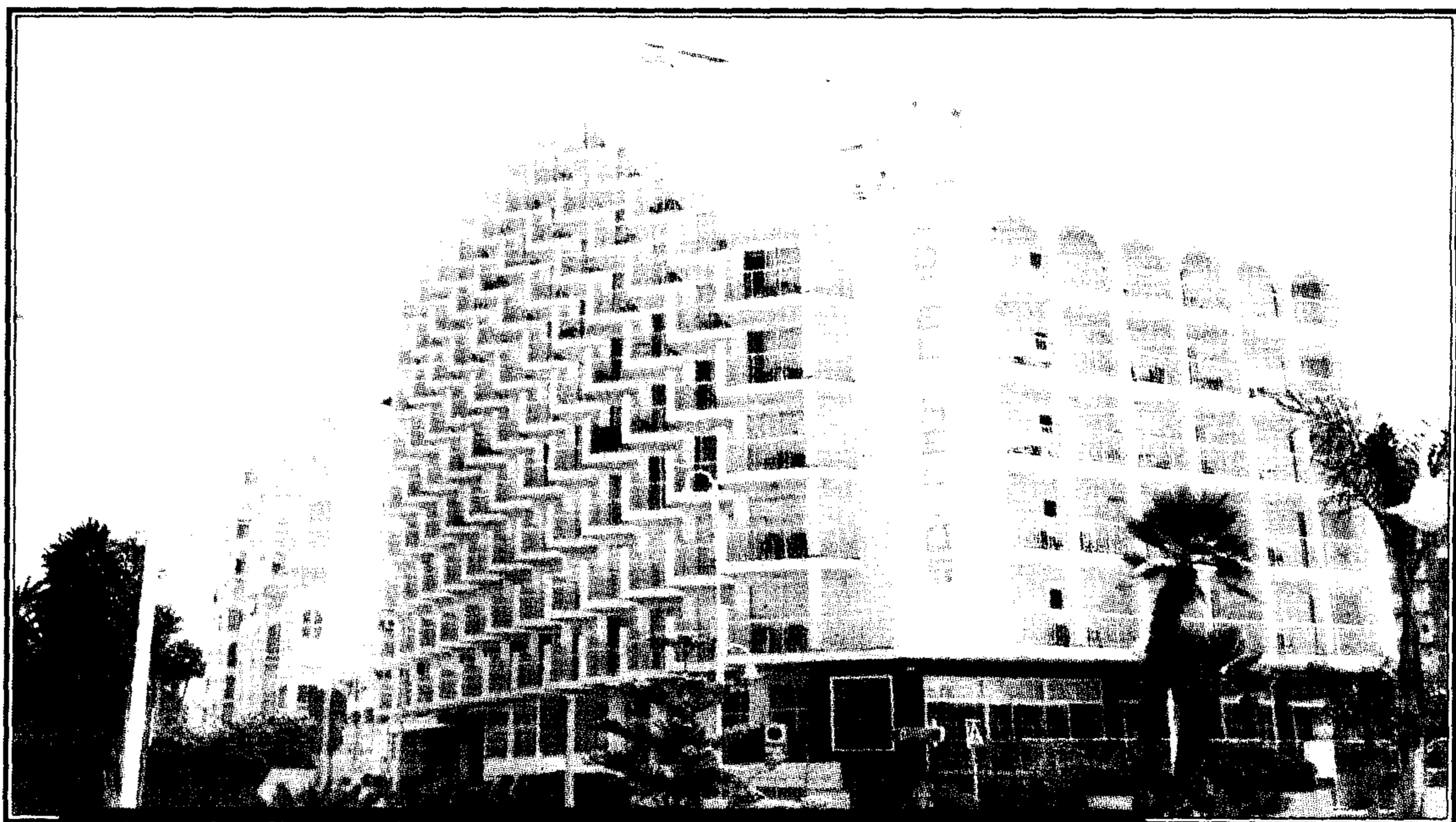
El Hotel Helios, en el Paseo de San Cristóbal de Almuñécar.

namiento un nuevo bufett, además de shows de cocina en vivo. Para los niños pequeños, el Hotel Helios ofrece un completo programa de animación infantil durante las horas de la tarde. Por esa razón, el Helios es uno de los hoteles favoritos de los jiennenses dado su perfil familiar y la amplitud de sus habitaciones, que permite alojar con facilidad a las familias con niños. Su apuesta por la innovación se demuestra diariamente. Es por ello, que una de las preocupaciones de la empresa es la formación continua del personal con cursos de idiomas, inglés o alemán, además de cursos de cocina y otros.