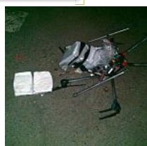
Droga que cae del cielo The Objective