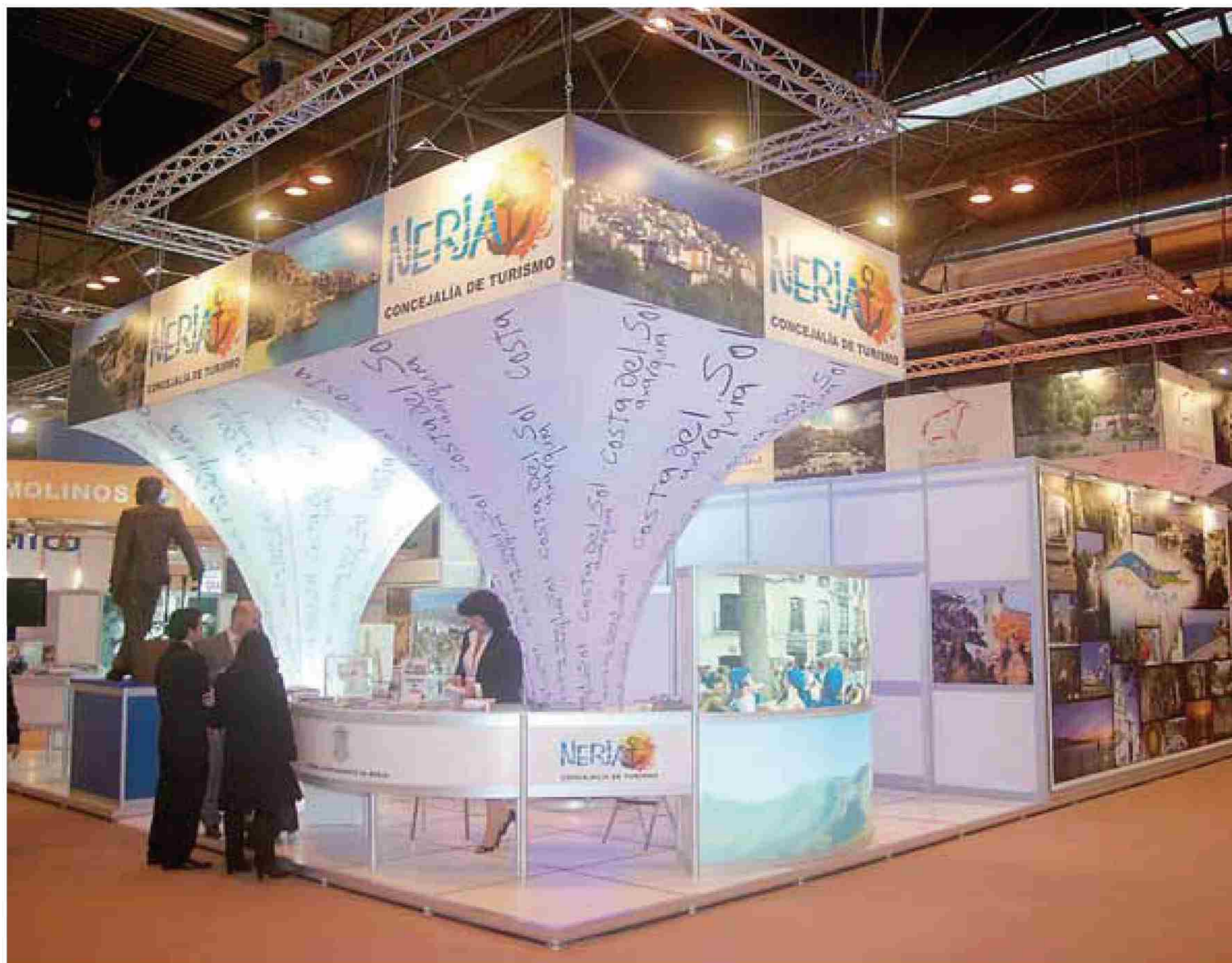
Los municipios de Nerja y Frigiliana han acudido con 'stand' propio a las últimas ediciones de la feria.

En esta reuniones, el presidente del ente mancomunado ha explicado que la promoción de la zona se tiene que basar en el binomio litoral-interior, «que tan bien han explotado en los últimos años localidades como Nerja y Frigiliana», matizó. Así, explicó que está trabajando conjuntamente con el