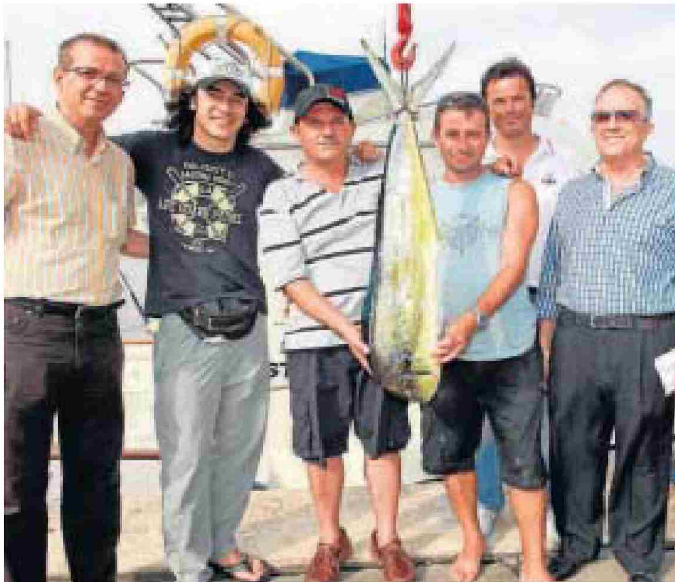
La embarcación 'Saint Tropez' con la pieza ganadora.

Ambos consiguen el anzuelo de oro en las categorías de Peso Total y Pieza Mayor, respectivamente