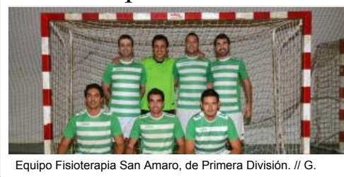
Equipo Fisioterapia San Amaro, de Primera División. // G.