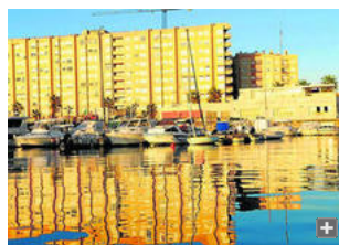
Imagen del Real Club Marítimo de La Línea.