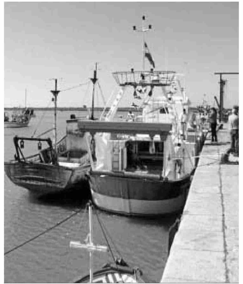
Puerto de El Terrón.

Los interesados en la convocatoria dispondrán de plazo hasta el próximo 7 de abril para presentar sus propuestas. Una vez seleccionado el proyecto, habrá de realizarse la tramitación del otorgamiento de la concesión para, poder comenzar posteriormente las obras.