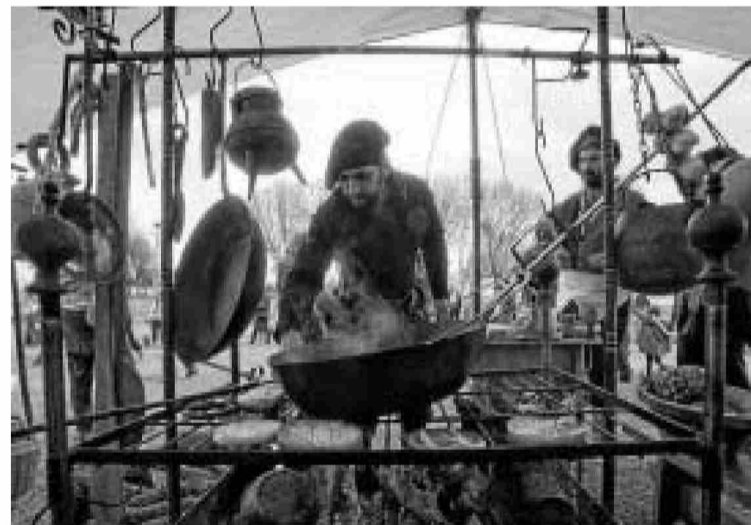
Uno de los puestos gastronómicos, durante la pasada edición.